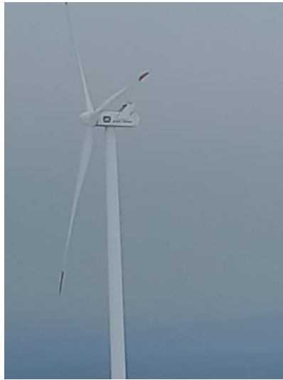
Obr. č. 8