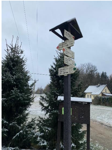
Obr. č. 7